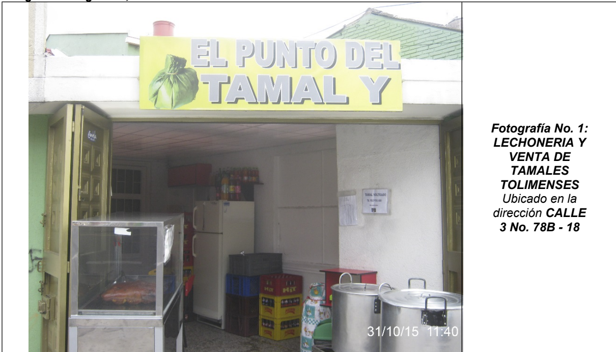
Fotografía No. 1: LECHONERIA Y VENTA DE TAMALES TOLIMENSES Ubicado en la dirección CALLE 3 No. 78B - 18

Registro fotográfico, Visita No. 2 efectuada el día 31/10/2015